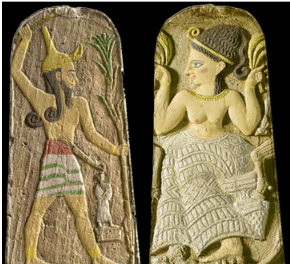
En egyptisk Astarte

ne. Det er ved hjelp av de merkelige ordene, og Lucifers lenke, at magien iverksettes. Nommen er uforståelig og kan nok ikke tolkes. Formelen er utslag av bindemagi, som er ganske vanlig i det norske materialet. Sannsynligvis tar oppskriften sikte på å klumse, det vil si paralisere motstanderen.