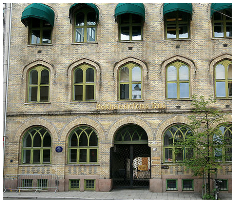
Øvre Vollgate 15 i Oslo ble bygget som Hartvig Nissens skole i 1860.