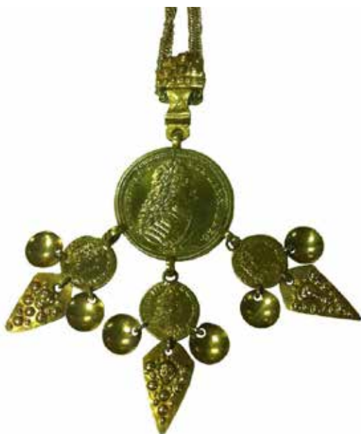
Brudedaler fra 1733 (NF.1898-0333). Tilhører Norsk Folkemuseum