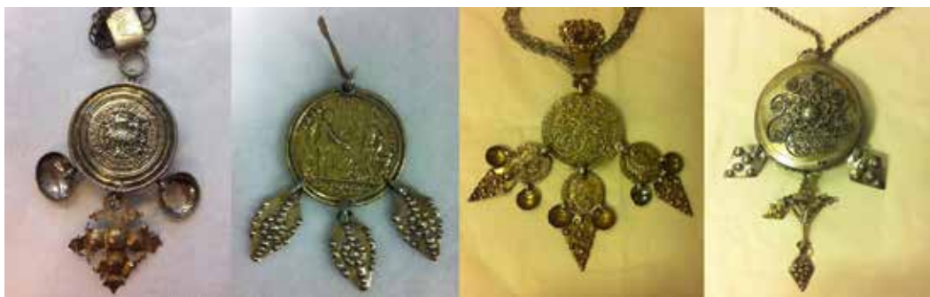
Fire brudedalere fra Norsk Folkemuseums samling: 1) NF.1999-3351 2) NF.1954-0111, fra 1791, brukt i Sigdal, produsert i Bergen 3) NF.1991-0352, brukt i Ørsta 4) NF.1991-0357, brukt i Romsdal.

lutherske kirkes teologi. At både kirkelig velsignelse og materialet i seg selv kan ha vært kilden til gjenstandens virkningskraft viser hvordan ulike sosiale forestillinger kan materialiseres i samme gjenstandstype. Vernemidler kunne “aktivteres” i situasjoner der en var spesielt utsatt. Ulike forståelser av sammenhengen mellom det åndelige og jordiske reflekteres gjennom bruk av vernemidler, som eksempler på en pragmatisk trosutøvelse, i kontrast til en teoretisk forståelse av den gjeldende teologien. Brudedalere har altså blitt brukt både for å vise sosial posisjon og velstand, samtidig som de skulle beskytte mot ulike krefter. De har dermed både vært til pryd og til beskyttelse, med betydning i, og utover sin materielle form.