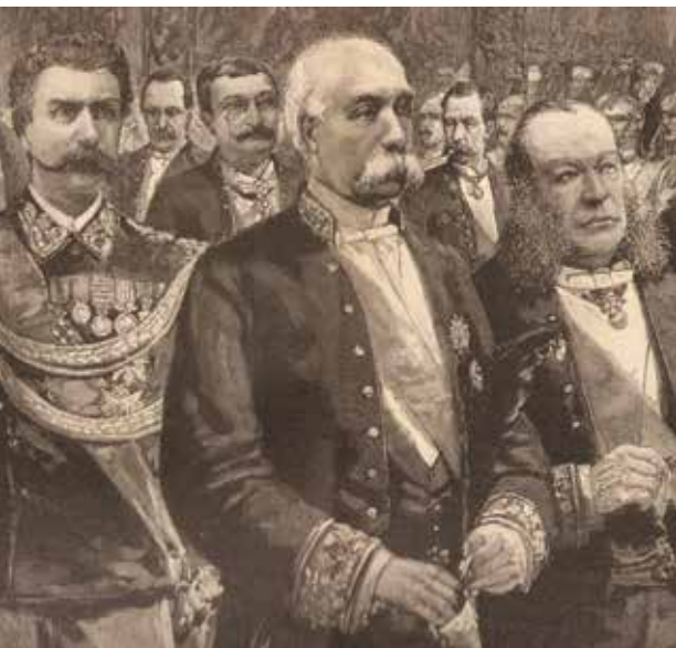
Statsminister Francesco Crispi omgitt av sine ministre i Palazzo del Quirinale i Roma. Illustrazione Italiana del gennaio, 1888.

Som amulett hadde en gjerne en figurlig avbildning av et cornicello , et dyrehorn i miniatyr, laget av edelmetall, elfenben, perlemor eller korall. Den italienske stats- minister Francesco Crispi (1819-1901) fra Napoli, bar alltid et korallhorn i urkjedet. I