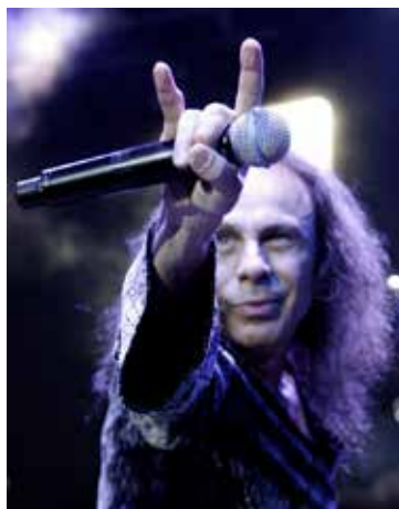
Ronnie James Dio (1942-2010)

metal-artisten Ronnie James Dio, som skulle ha lært tegnet av farmoren sin.