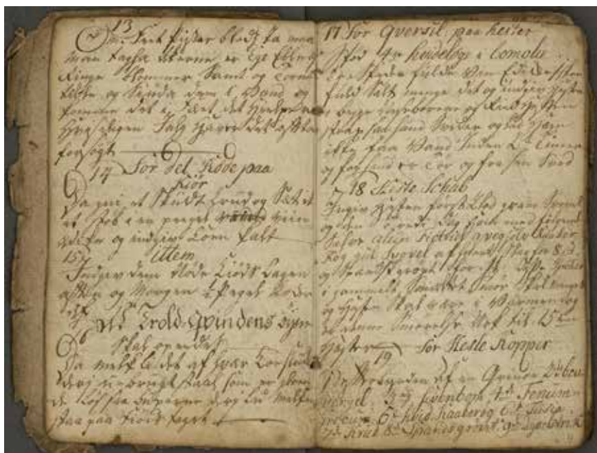
Oppskriften om å ødelegge trollkjerringas øye sees nederst til venstre i Svarteboka fra Hurum, NBO.

Det var opplagt det triste uttrykk for sparsom innsikt i menneskenaturen, bristende holdninger, og tidligere tiders begrensede kunnskaper om legevitenenskap og medisiner, som gjorde at folk av redsel tok avstand fra dem som av avvikende