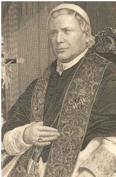
Pave Pius IX i xylografisk portrett fra 1873.

gik vel alligevel. Der er imidlertid pudsigt nok præservativer imod gettatori. Saaledes er det næsten ufeilbarligt at stikke pege- og lillefinger frem for sig som to horn. Der fortælles, at ved Pio Nonos audientser gjorde alle det i al hemmelighed! – Ude i landsbyerne i fjeldene sættes to polerede bøffelhorn op paa fod som stas; men i